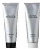
クリエイティブ フェリエ ネオ フローム 【ティント デザイン】 F/プースター・F/シアー NET.80g/240g