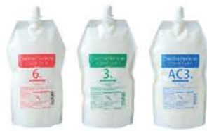
クリエイティブ フェリエ ネオ カラーオキシド 6%・3%・AC3%(アルカリキャンセル) NET.1000g